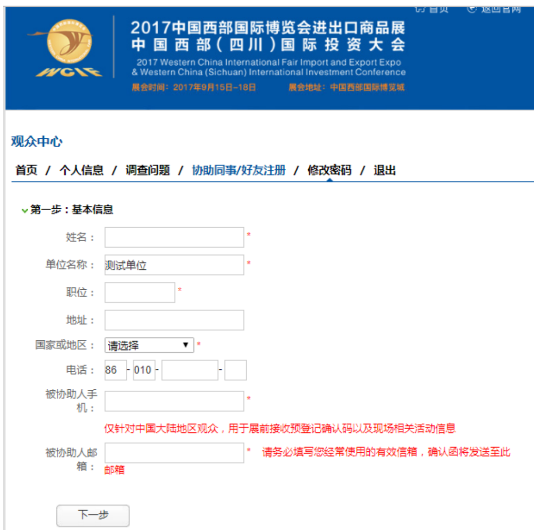
图 2-9 帮助好友注册