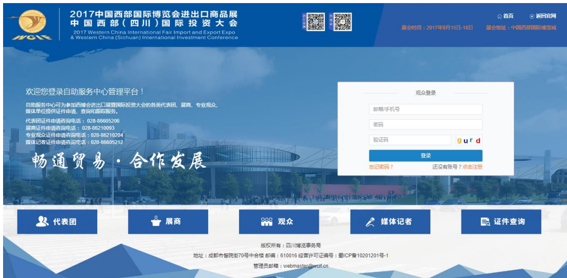
图 1-1 观众网上服务登录界面

观众网上自服务系统是为观众提供信息注册、信息提交、帮助他人登记的自助服务平台。其访问地址： http://reg.wcif.cn/ ；点击“专业观众”图标打开专业观众的自助服务界面。