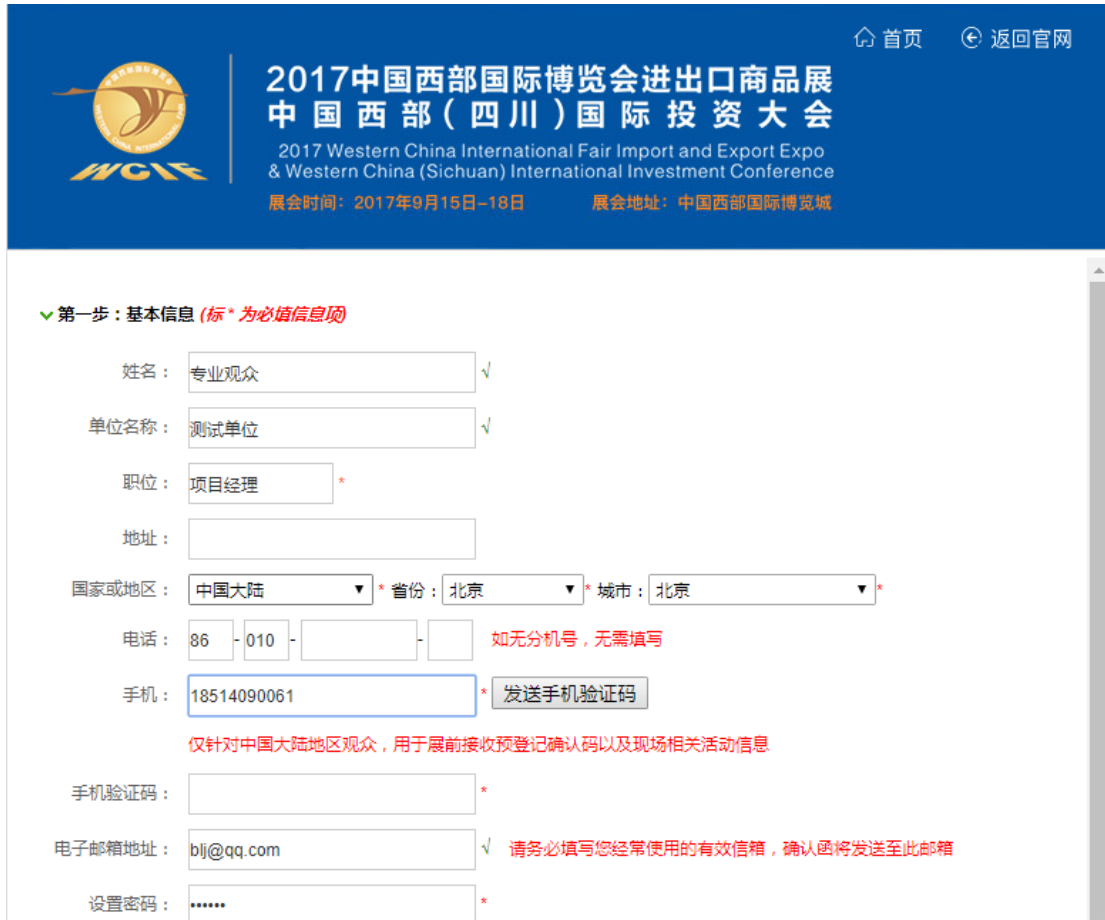
图 2-3 观众注册页面

注册成功后,待工作人员审核通过,系统会发送 ID 码到注册邮箱和手机,观众凭 ID 编码在展会现场领取参展证件。