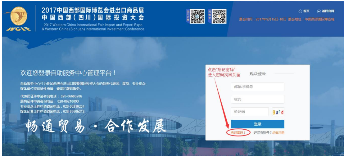
图 2-1 找回密码